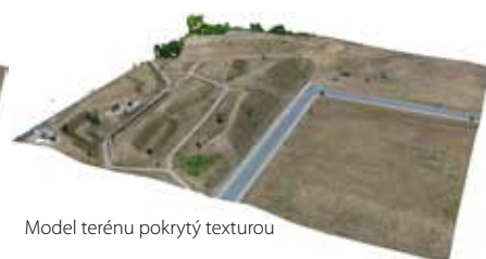
Model terénu pokrytý texturou