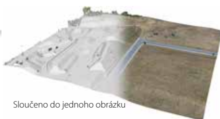
Sloučeno do jednoho obrázku